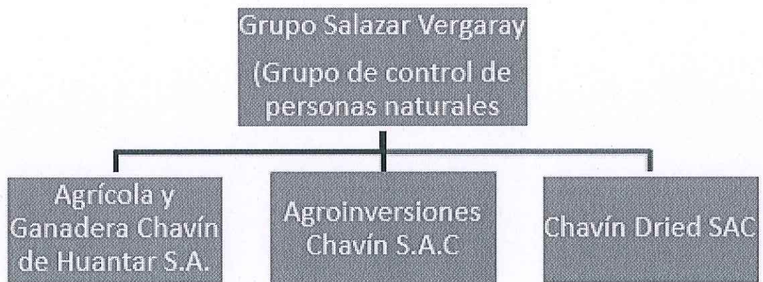
Diagrama del grupo económico de Agrícola y Ganadera Chavin de Huantar SA

Agrícola y Ganadera Chavín de Huantar SA 100% Agroinversiones Chavín SAC 100% Chavín Dried SAC 50%